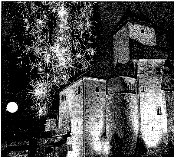
Die verträumte Burg Wernberg bietet ein festliches Ambiente für die Hochzeitszeremonie.

Ein weiteres Hochzeits-Special, das auf der Burg Wernberg angeboten wird, ist das romantische Arrangement „Hochzeit zu Zweit“. In dem Paket sind zwei Übernachtungen in der exklusiven Graf-Schall-Suite, inklusive einem genüsslichem Burgfrühstück vom Buffet enthalten. Als kleine Besonderheit darüber hinaus bietet das Haus eine speziell für zwei Personen angefertigte vierstöckige Hochzeitstorte an, die sich das Hochzeitspaar gemeinsam schmecken lassen kann.