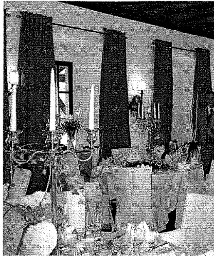
Eine exquisite Speisekarte, eine stilvolle Tischdekoration, ein fürstlicher Saal – alle Komponenten zusammen machen das Hochzeitsmahl auf Burg Wernberg zu einem unvergesslichen Erlebnis.