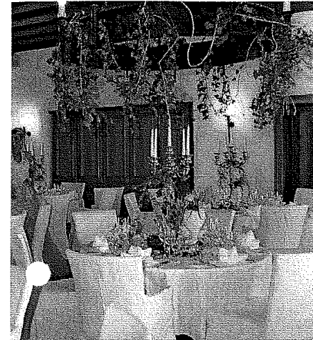
Eine exquisite Speisekarte, eine stilvolle Tischdekoration, ein fürstlicher Saal – alle Komponenten zusammen machen das Hochzeitsmahl auf Burg Wernberg zu einem unvergesslichen Erlebnis.