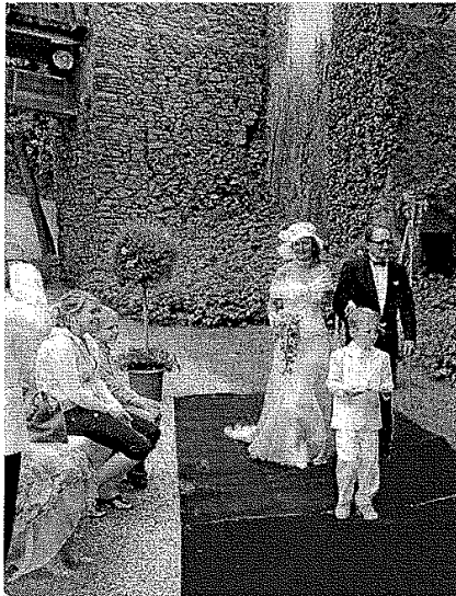
Für das Brautpaar wird selbstverständlich auch der rote Teppich ausgerollt.